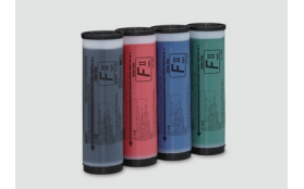
RISO MÜREKKEP FII TİP BLACK (1000 ml)

RISO i Quality işareti, RISO i Quality sistemi ile uyumlu bir RISO ürünü gösterir