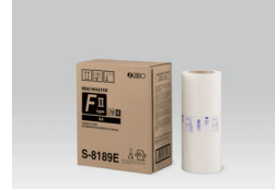
RISO MASTER FII TİP (A4: 295 yaprak)