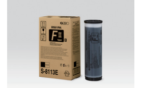
RISO MÜREKKEP FII TİP BLACK (1000 ml)