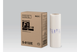
RISO MASTER FII TİP (B4: 250 yaprak)