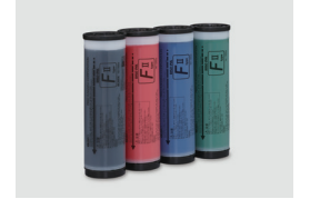
RISO MÜREKKEP FII TİP BLACK (1000 ml)

RISO i Quality işareti, RISO i Quality sistemi ile uyumlu bir RISO ürünü gösterir