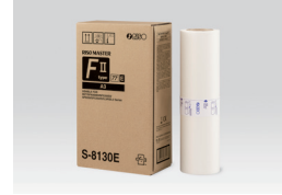
RISO MASTER FII TIP (A3: 220 yaprak)