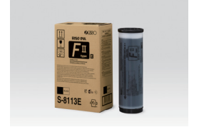
RISO MÜREKKEP FII TİP BLACK (1000 ml)